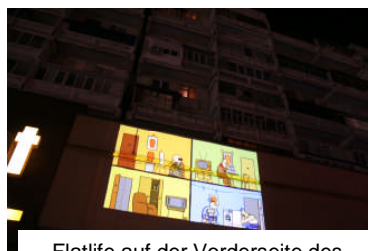
Flatlife auf der Vorderseite des Wohnblocks