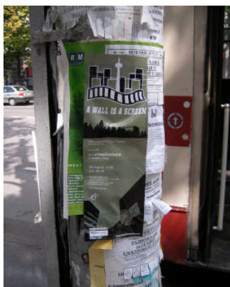
Werbung für unsere Veranstaltung

Dreimal werden wir an diesem Abend von unterschiedlichen Polizeieinheiten kontrolliert. Auch hier wieder die Unsicherheit über die non-verbale Kommunikation. Alles sieht sehr streng aus, sehr ernst. Werden wir verhaftet? Nein, die Pässe sind in Ordnung. Auch hier helfen wieder russische Sprachbrocken, zu erfahren, dass die Streife es bedauert, nicht länger mitgehen zu können und auch am nächsten Tag arbeiten müsse. Die Frau kann auch nicht kommen, ihre Schwester ist aus Taschkent zu Besuch.