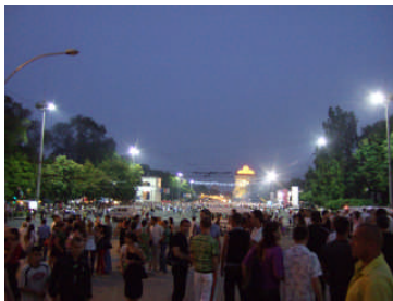
Feierlichkeiten zum Jahrestag der Staatsgründung

Spaziergang durch die Stadt. Großzügige Sozialistische Bauweise an der Prachtstraße Stefan cel Mare, nur „Stefan“ genannt, prägt das Bild der Stadt. An diesem Abend ist die ganze Bevölkerung unterwegs, es ist der Jahrestag der Gründung der Republik.