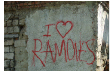
Eines der wenigen Graffiti's

Unsere Kommunikationsversuche entlocken unserem Gegenüber kein Lächeln. Auch auf der Straße wird nicht gelacht. Keine Miene wird verzogen, wenn Blicke sich treffen. Wir fragen nach und erfahren, dass der Moldauer es nicht schätzt, in der Öffentlichkeit Gefühle zu zeigen. Lächeln gilt als Schwäche.