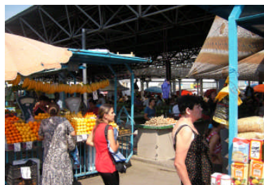
Auf dem Markt ist alles zu bekommen

Wir lassen uns durch die Stadt treiben. Oberleitungsbusse, genannt Trolleybusse, stellen das Nahverkehrsmittel. Wir pressen uns in einen Bus, sie sind alle überfüllt, obwohl alle zwei Minuten ein Bus kommt. Eine Fahrt kostet, egal wohin, ein Lei. Das entspricht 8 Cent. Ein riesiger Markt verkauft alles, was man für das Leben benötigt.