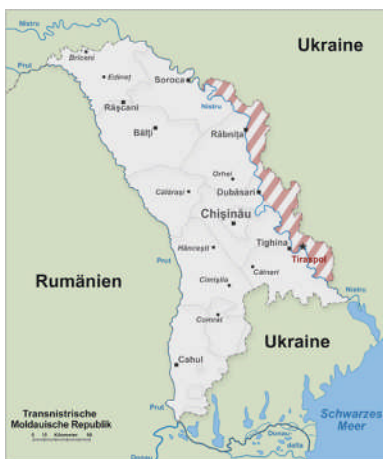
Lage Moldaus und Transnistriens

Die Republik zählt zu den ärmsten Ländern Europas. Im Rahmen des Georgienkonflikts wurde sie hin und wieder erwähnt, im Land selbst gibt es einen eigenständigen Staat, der nur von Russland anerkannt ist. Transnistrien, mit der Hauptstadt Tiraspol, hatte sich nach dem Krieg 1992 gegründet und lebt seit dem in einem schwelenden Konflikt an der Seite von Moldau.